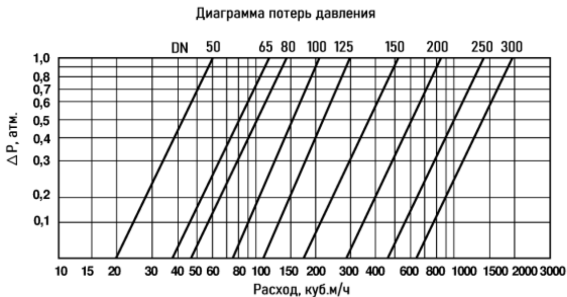
Диаграмма потерь давления в полностью открытом регуляторе

Потери давления при проходе рабочей среды через регулятор могут быть определены по диаграмме: