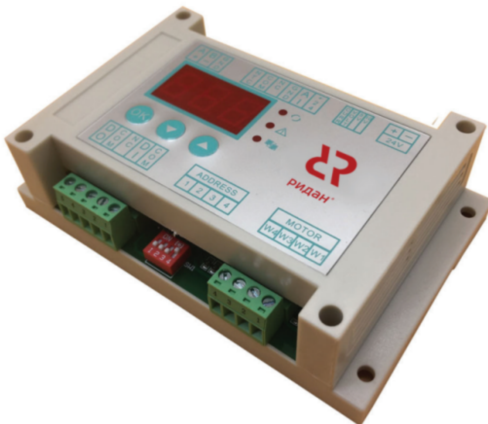
Рис. 1 Внешний вид контроллера

Контроллер типа Р-КИ выполнен в одном корпусе. Для настройки и отображения параметров используется встроенный дисплей.