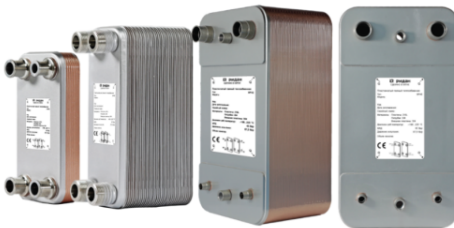
Рис.1 - Внешний вид теплообменников пластинчатых типа ВРНЕ

Теплообменники пластинчатые типа ВРНЕ предназначены для передачи тепловой энергии от одного теплоносителя к другому. Теплообменники пластинчатые типа ВРНЕ могут применяться в холодильных установках (компрессорных, абсорбционных), а также в тепловых насосах. В качестве рабочих сред могут использоваться с ГХФУ, ХФУ, ГФУ, ГФО и природные хладагенты не вступающие в реакцию с медью, технические и холодильные масла, вода для технических нужд и систем ГВС, спиртосодержащие растворы, водные растворы гликолей.